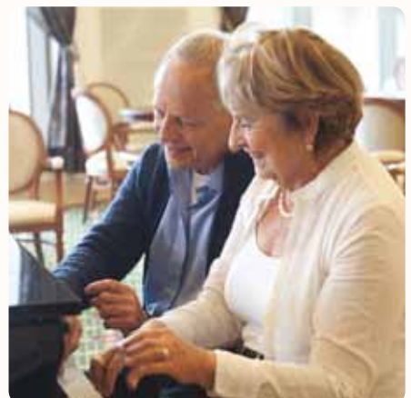
גלריה | איור: דניאל גורן

הבית בראשון לציון • הבית בהוד השרון • הבית בתל אביב • www.ad-120.co.il