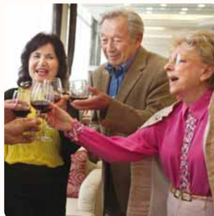
הזמן והשפה מסתובב פורח

• הבית בראשון לציון • הבית בהוד השרון • הבית בתל אביב • www.ad-120.co.il