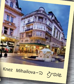
Knez Mihailova - ספינץ