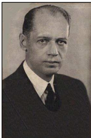
Ely Culbertson (1891-1955)

La contre-attaque du Roi de ♦ livrera au déclarant deux autres levées dans la couleur, mais elle le limitera à deux levées de ♣, alors que celui-ci en aurait disposé de six sur un flanc passif. Ainsi, le contrat chutera - après que vous aurez laissé passé un tour de ♣.